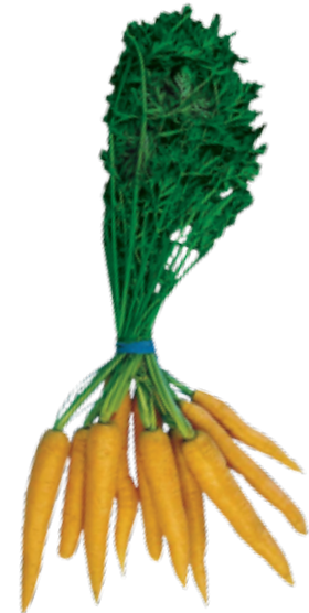
■ Svežanj šargarepa