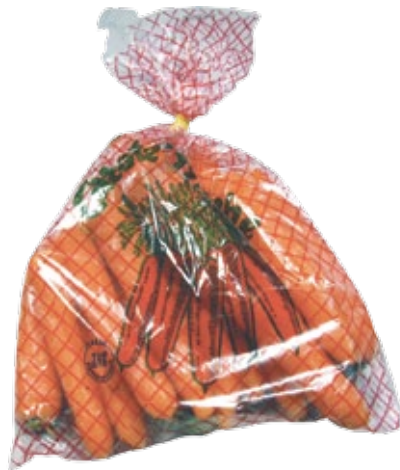
■ Šargarepe u manjem plasti nom paketu