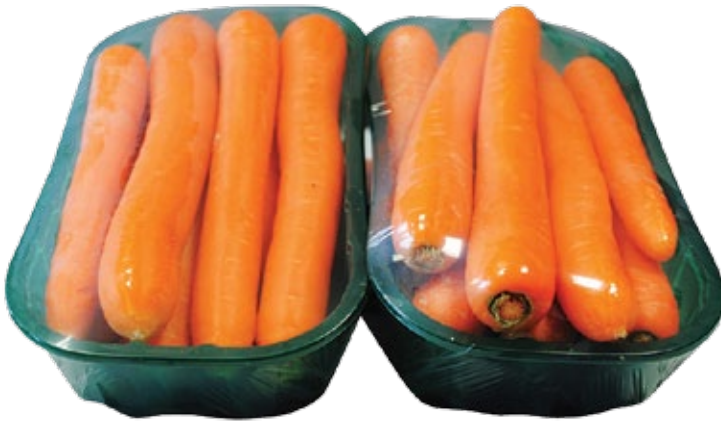
■ ŠARGAREPA - KLASIFIKACIJA PROIZVODA - PRAVILNO PAKOVANJE ZA EKSTRA KLASU*