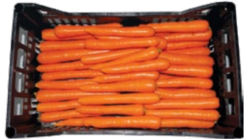
■ Šargarepa u plasti noj kutiji - PRAVILNO PAKOVANJE ZA KLASU I*

* unutar istog paketa Ekstra Klase i Klase I, veli ina i oblik šargarepa treba da budu jednoli ni