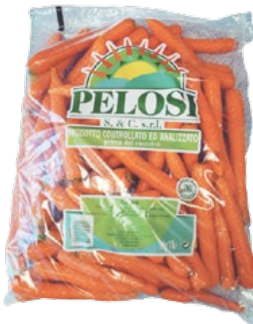
■ Šargarepe u plasti noj kesii - PRAVILNO PAKOVANJE ZA KLASU I

* unutar istog paketa Ekstra Klase i Klase I, veli ina i oblik šargarepa treba da budu jednoli ni